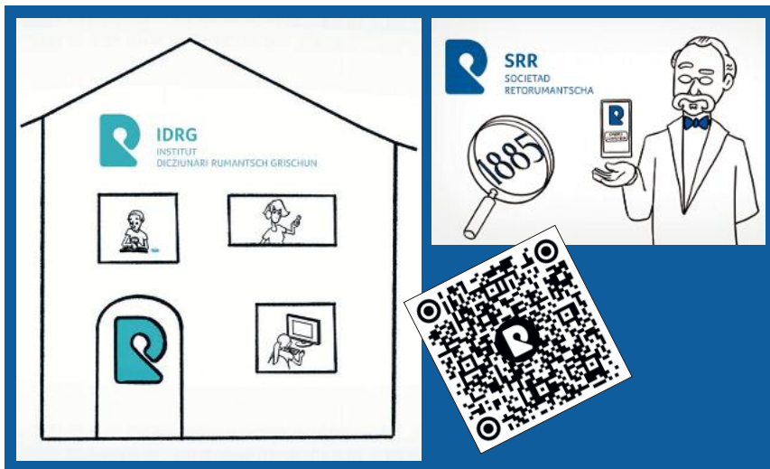
Stills von einem Werbevideo für die SRR, das man über den QR-Code anschauen kann.