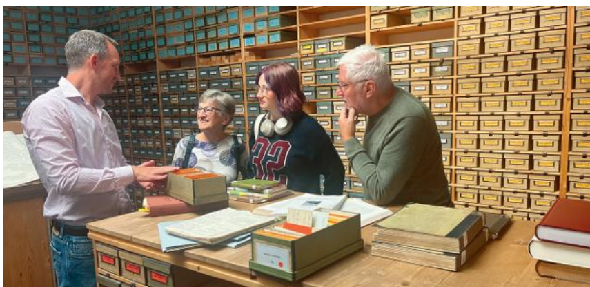
Tage der offenen Tür im IDRG am 10. und 11. Oktober: Präsentation des Faszikels 201/202 und Einblicke in das Material des Instituts (cf. Punkt 1 und 7.3).